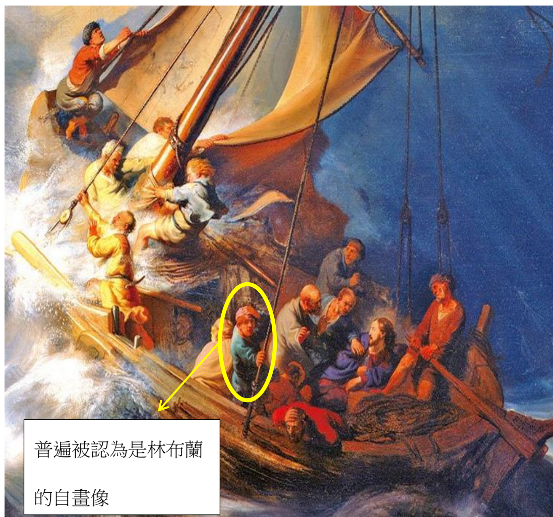
普遍被認為是林布蘭 的自畫像