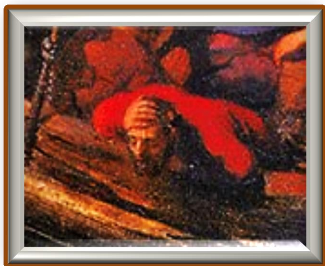
爺爺的朋友-查理 嚴重暈船，手扶著 頭，往船外嘔吐不止