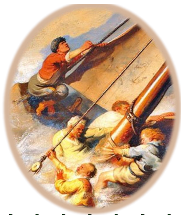
在加利利海上時，突然狂風 大作，傑恩和一些見狀趕 快把帆布收起來