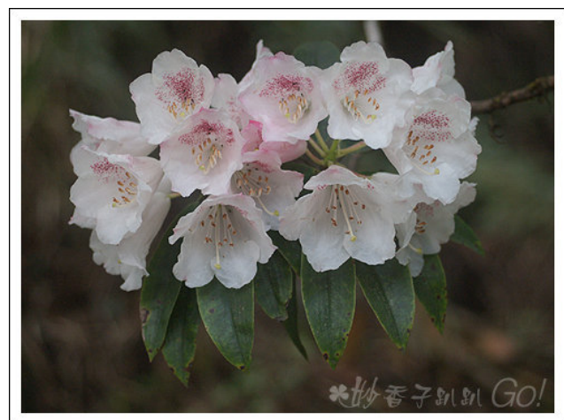
森氏杜鵑