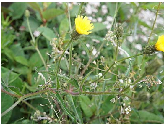
森氏山柳菊

森丑之助（1877年1月16日－1926年7月4日），是一位生於日本京都五條室町的人類學者及植物學家。身高才161公分且一腳微跛，但依舊不能改變他喜歡探險本性，百餘年前，當時才18歲的森丑之助就跟隨日本陸軍來台，為深入台灣做調查，他往來台灣山地各部落間、結交各部落的朋友並學習他們的與語言；他尊重不同民族不同的文化，並想把當時未受外來文化影響的原住民傳統及語言記錄下來；所以著有《台灣番族志》及《台灣番族圖譜》、並發表排灣番語集、布農番語集等番語實用範本。在植物學方面，他雖未正式受大學教育，但他跟著日本植物學教授小西成章學習，隨同他至人跡未至的深山作植物調查，有時不顧生命危險攀爬懸崖就為採集標本，所以在植物學方面有豐碩的成果，台灣有很多高山品種的植物是森丑之助發現的，這些植物就以他的姓氏做命名，如森氏杜鵑、森氏山柳菊、森氏紅淡比等二十多種植物。