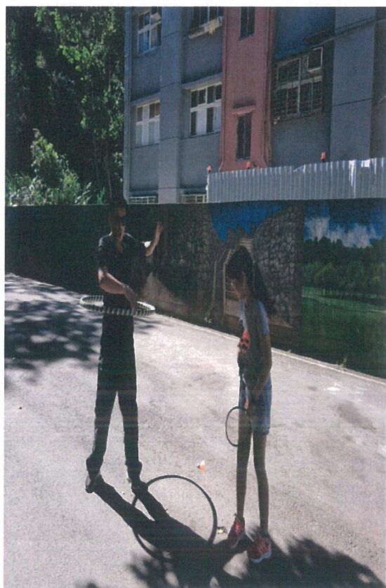
3.爸爸使出渾身解數，我也努力地拍羽球