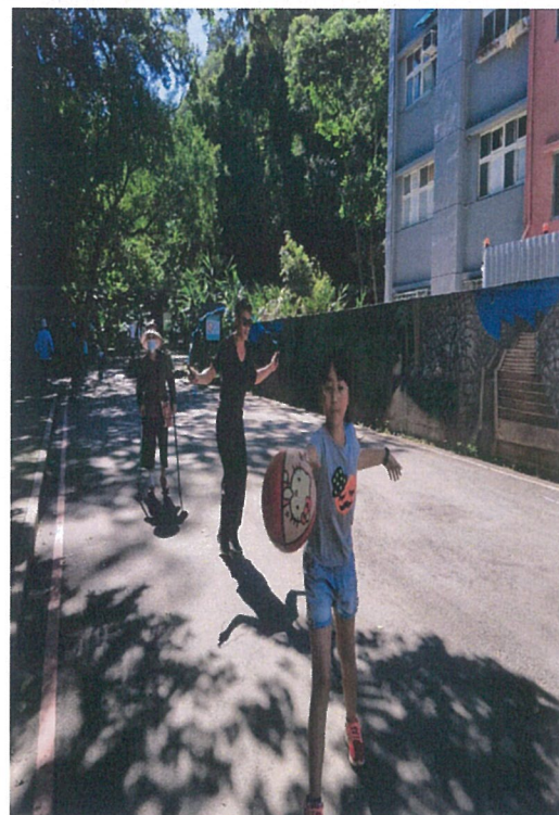
2.爸爸跳繩我拍球，看誰先完成任務就能進行下一關