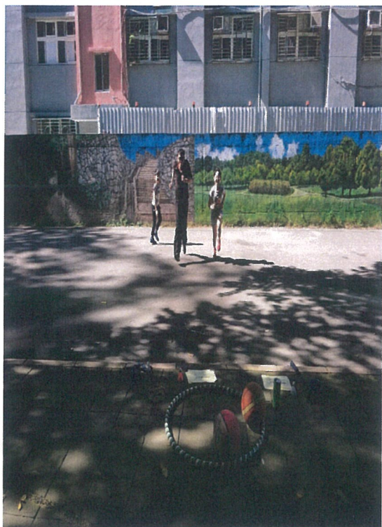
1.比賽開始，看誰跑得快